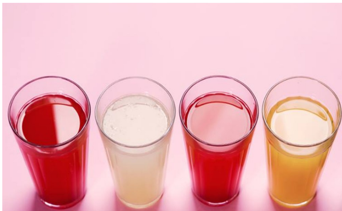
Nadir Figueiredo

A Nadir foi comprada pela Vidros da Glória Participações, da gestora H.I.G, no ano passado. A companhia poderá fechar capital ainda neste mês, após a realização de oferta pública para aquisição de ações (OPA) pela sua controladora.