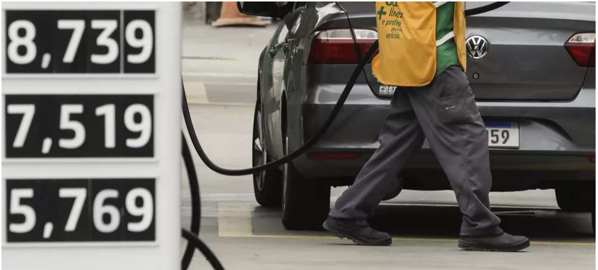
Posto de combustível no Rio: após trégua em dezembro, preços da Petrobras nas refinarias voltam a subir 4,85% para gasolina e 8% para o diesel

A Petrobras anunciou um reajuste médio de 4,85% no preço da gasolina e um aumento de 8% no diesel vendido para as distribuidoras, nas refinarias, válido a partir de hoje. Principal vilão da inflação no ano passado, o preço dos combustíveis começa 2022 novamente pressionado pela valorização do petróleo no mercado internacional.